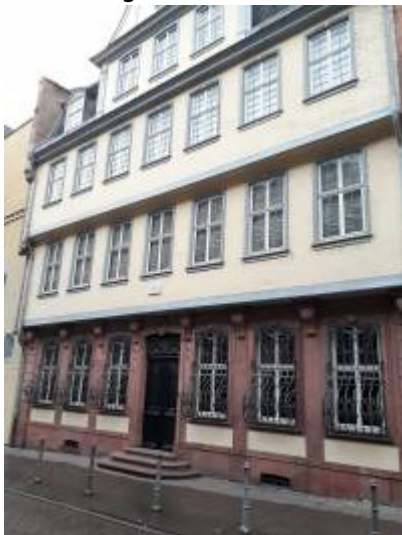
Abbildung 4: Adresse Großer Hirschgraben 23-25, 60311 Frankfurt am Main