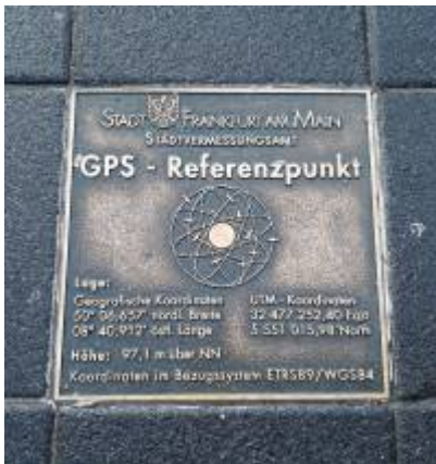
Abbildung 3: Koordinaten 50° 06,657' N 08° 40,912' E