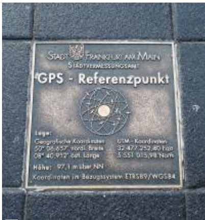
Abbildung 3: Koordinaten 50° 06,657' N 08° 40,912' E