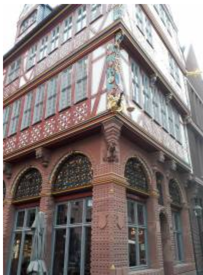
Abbildung 1: „Wir treffen uns vor der goldenen Waage“

From: https://www.foc.neu.geomedienlabor.de/ - Frankfurt Open Courseware