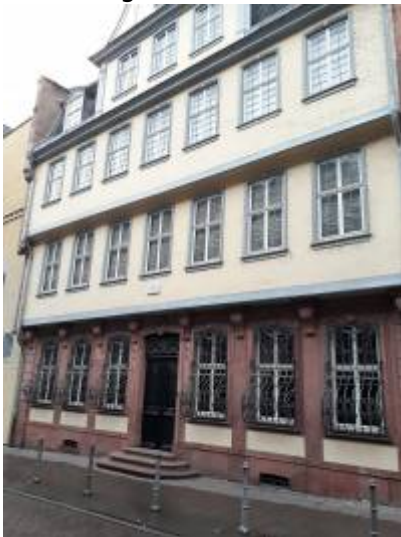
Abbildung 3: Adresse „Großer Hirschgraben 23-25, 60311 Frankfurt am Main“