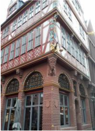
Abbildung 1: Verbale Beschreibung „Wir treffen uns vor der goldenen Waage“