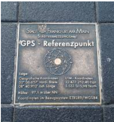
Abbildung 3: Koordinaten 50° 06,657' N 08° 40,912' E