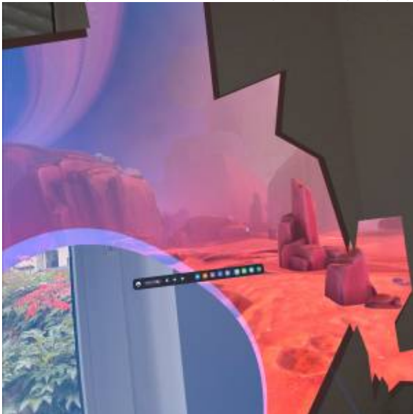
Abbildung 6: Aufnahme beim Überschreiten der Begrenzung

Begrenzungen können bei den Einstellungen unter Physischen Raum festgelegt oder bearbeitet werden.