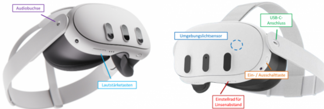
Abbildung 1: Aufbau des Headsets; eigene Darstellung verändert von links externe Verlinkung (10.10.2024) und rechts externe Verlinkung (10.10.2024)