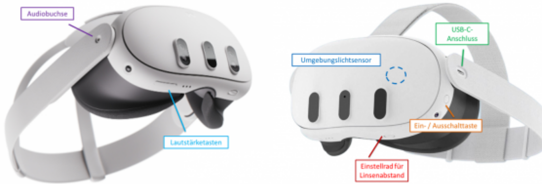
Abbildung 1: Aufbau des Headsets; eigene Darstellung verändert von links externe Verlinkung (10.10.2024) und rechts externe Verlinkung (10.10.2024)