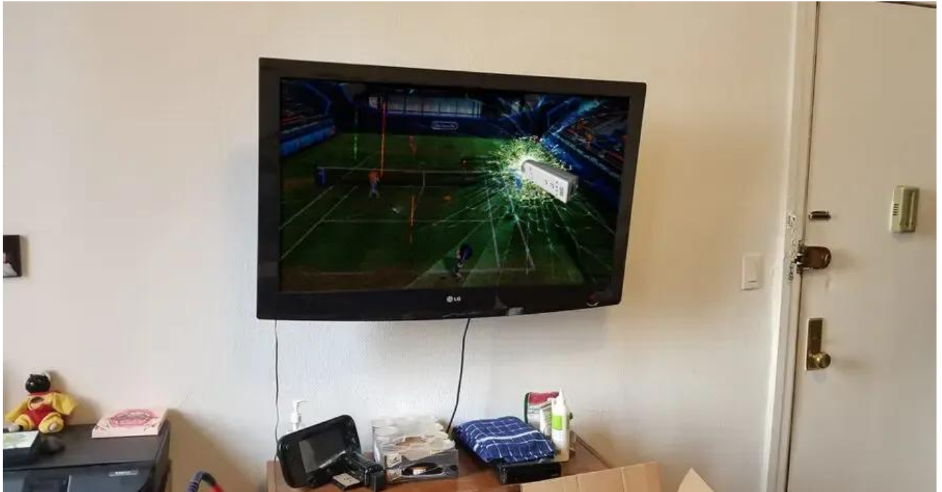
Abbildung 1: Controller-Unfall

Wir bitten Sie, bei der Nutzung der Controller die Handschleifen anzulegen . Dies dient nicht nur zur Sicherheit der Controller selbst, sondern auch zur Sicherheit Ihrer Umgebung.